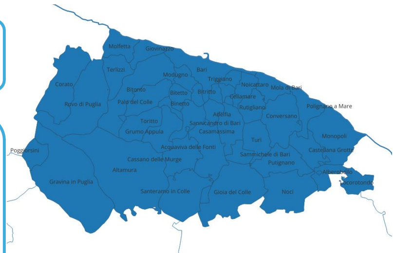
Localizzazione: Tutta l'area metropolitana di Bari

Tali finalità, previste dal Piano Regionale delle Politiche Sociali e dunque promosse nei Piani Sociali di Zona degli Ambiti Territoriali Sociali, prevedono più tipologie di interventi fra loro interconnessi. 1) Il rafforzamento della Porta Unica di Accesso e delle Unità di Valutazione Multidimensionale (UVM) per favorire un accesso più rapido e non discriminatorio. 2) Il potenziamento delle ore di Assistenza Domiciliare Integrata (ADI), mutuandone il modello da uno prestazionale ad uno di cura multidimensionale, e delle opportunità di accedere ai servizi domiciliari a domanda individuale. 3) Il consolidamento dei Centri Aperti Polivalenti e dei Centri Diurni rivolti a persone con disabilità, anche attraverso una compartecipazione degli ATS, dei Comuni e delle famiglie. 4) La promozione delle opportunità economiche offerte ai caregivers, nonché l'implementazione di azioni di sostegno extra-economico. 5) Il rafforzamento dell'assistenza specialistica per l'integrazione scolastica degli studenti con disabilità, comprensiva del trasporto scolastico.