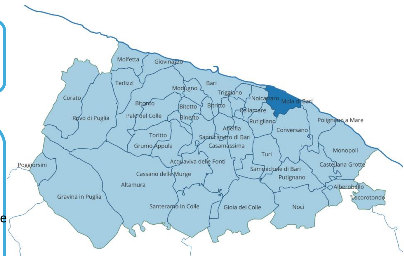
Localizzazione: Mola di Bari

Infine, le aree verdi saranno strategicamente integrate nella realizzazione degli ambienti, creando spazi ombreggiati e un'atmosfera lussureggiante, contribuendo a fornire un'esperienza unica agli ospiti e a rinvigorire la vegetazione locale.