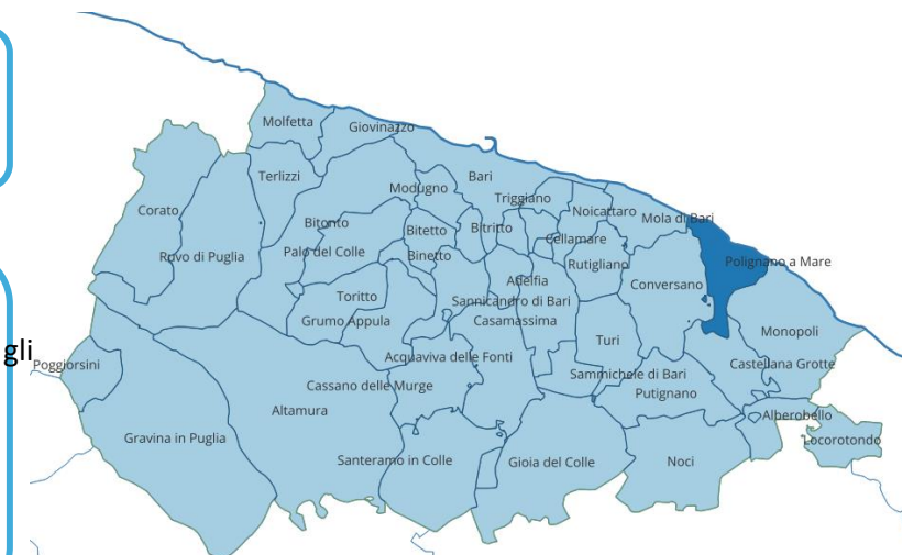
Localizzazione: Polignano a Mare

Tra gli interventi previsti vi sono la rinaturalizzazione delle aree costiere, la realizzazione di superfici drenanti, la regolamentazione della presenza all'interno del bacino delle imbarcazioni e la riorganizzazione degli ormeggi e delle aree di alaggio.