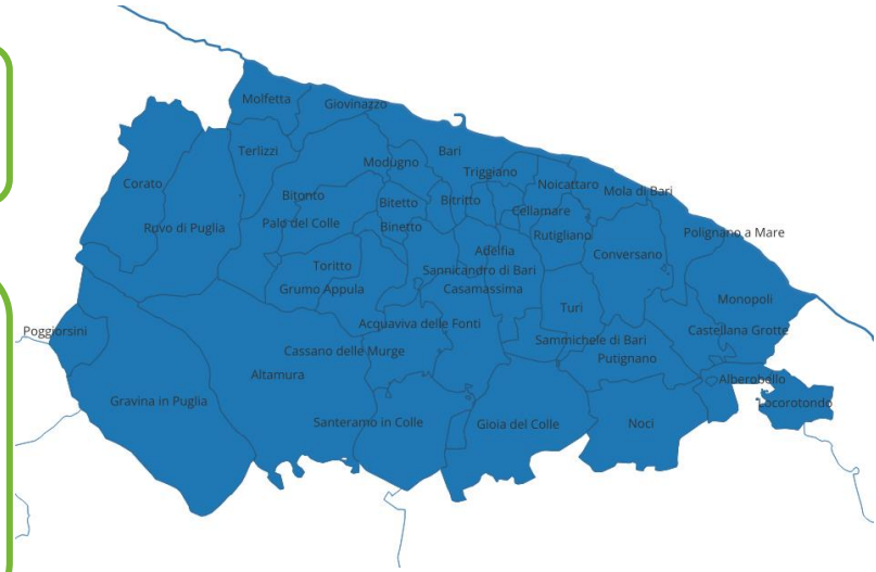
Localizzazione: Tutta l'area metropolitana di Bari

L'azione si propone di migliorare l'accessibilità ai servizi anche per gli utenti soli o con ridotta mobilità, sviluppando strumenti IT funzionali alla loro fruizione. Costituiscono parte integrante dell'azione: • Creazione di una piattaforma online per semplificare la prenotazione e la gestione degli appuntamenti presso i Centri di Assistenza domiciliare; • Integrazione di soluzioni che consentano agli utenti dei Centri di Assistenza di ricevere supporto o consulenza anche da remoto, riducendo la necessità di spostamenti fisici; • Sviluppo di applicazioni mobili intuitive per consentire agli utenti di accedere facilmente alle informazioni sui servizi offerti e ricevere notifiche importanti.