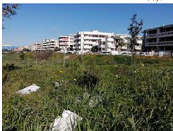
Comune di Conversano