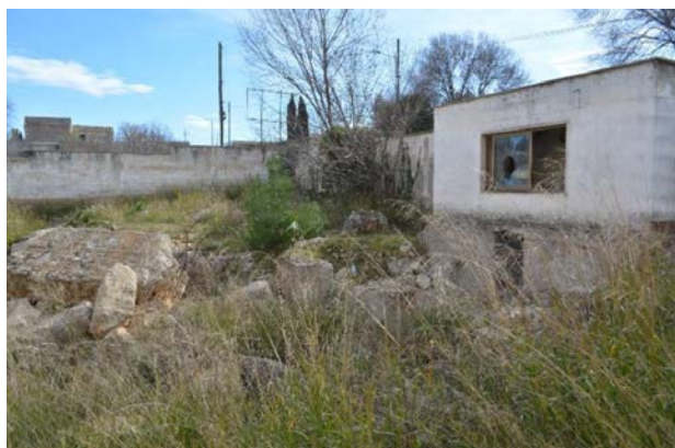
Comune di Castellana Grotte