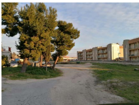
Comune di Ruvo di Puglia