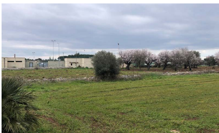
Comune di Sammichele